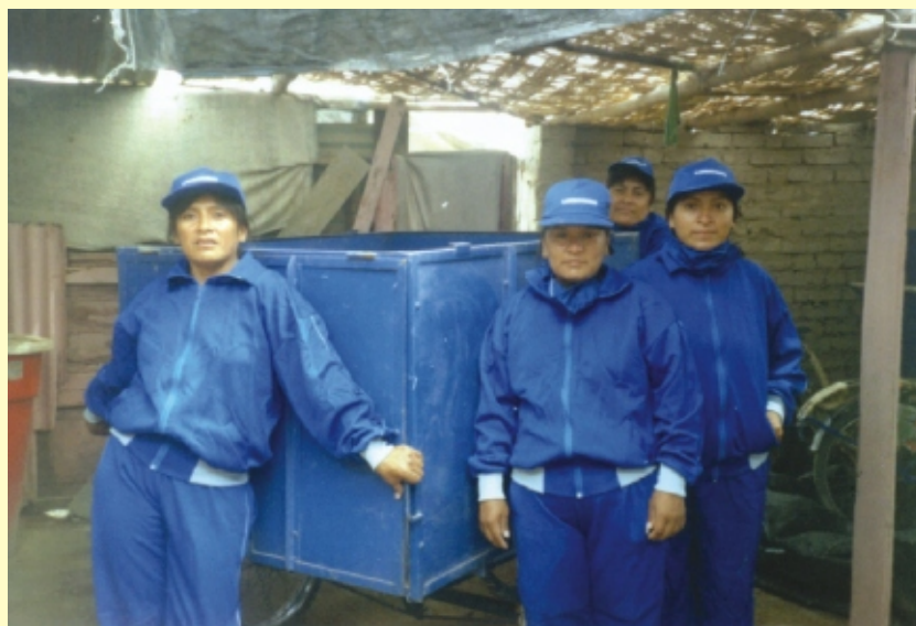
Microempresa de manejo de residuos sólidos formada por mujeres. Ciudad Eten, Lambayeque. 2003.