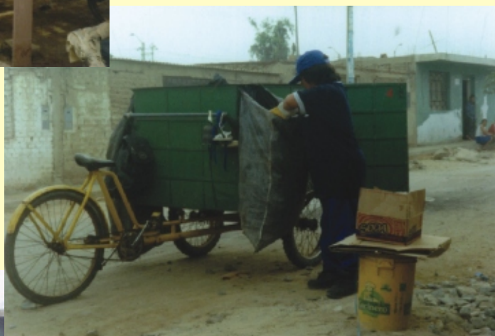
Carrito de recolección. Asentamiento humano El Porvenir, Trujillo, Perú, 2003.