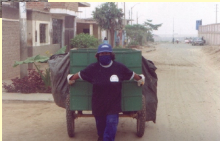
Recorrido de recolección. Asentamiento humano El Porvenir, Trujillo, Perú, 2003.