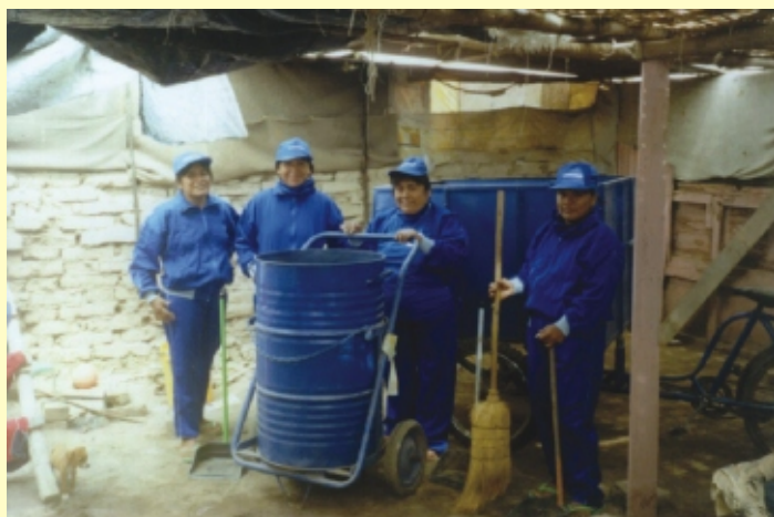
Equipo de barrido. Ciudad Eten, Lambayeque, Perú, 2003.