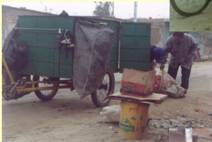
Equipo no convencional. Asentamiento humano El Porvenir, Trujillo, Perú, 2003.